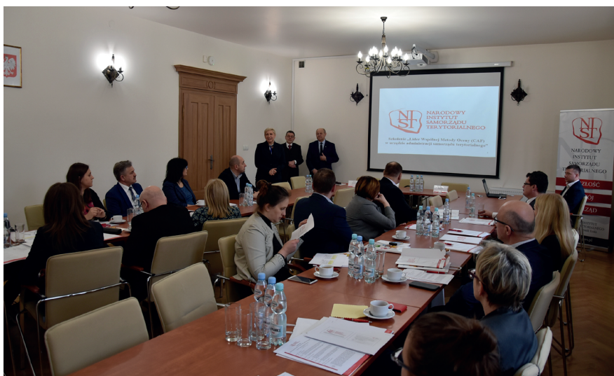
Szkolenie „Lider Samooceny CAF w jednostce samorządu terytorialnego”, siedziba NIST, 10 marca 2017 r.