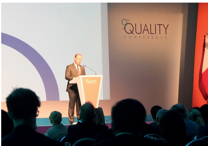
Premier Republiki Malty, Dr. Joseph Muscat podczas otwarcia konferencji 16 maja 2017 r. Malta

Formularz zgłoszeniowy prosimy wypełnić i przesłać do dnia 31 lipca br. na adres: rejestracja@nist.gov.pl