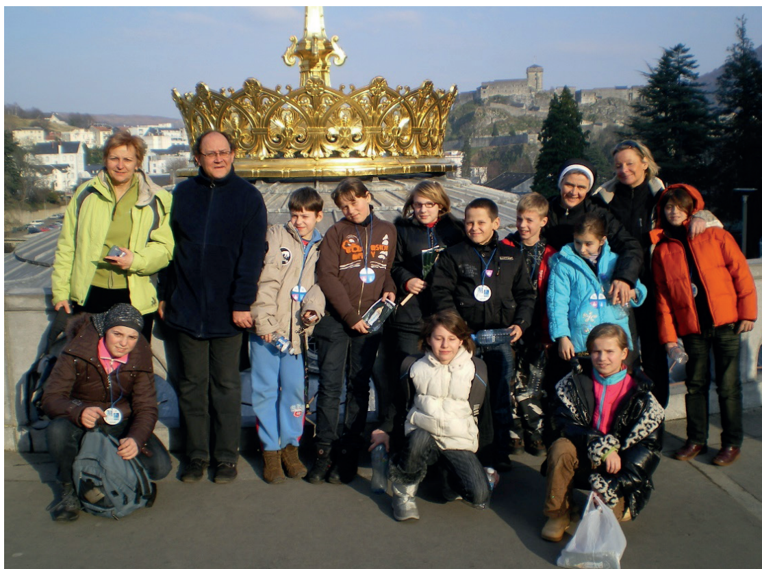
Kolonie integracyjne w Lourdes