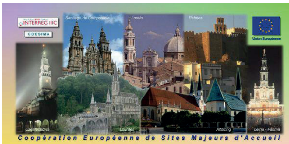
COESIMA Europejska Współpraca Miast Ośrodków Pielgrzymkowych