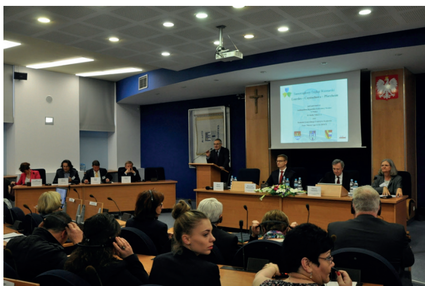
„Samorządowy Trójkąt Weimarski Lourdes –Pforzheim – Częstochowa”