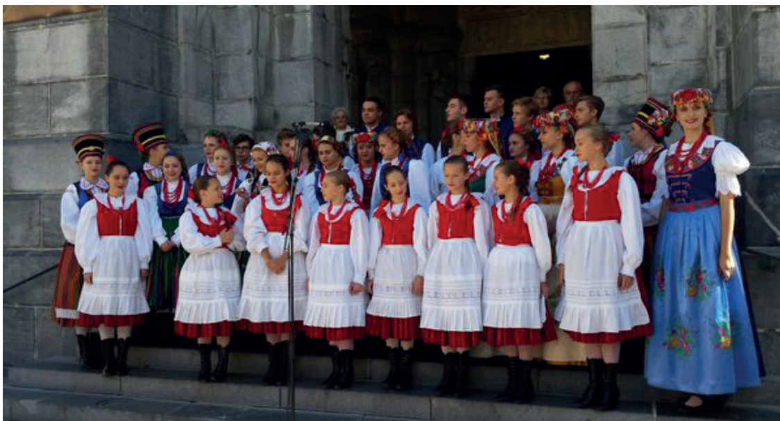
Wieczór folkloru francusko – polskiego