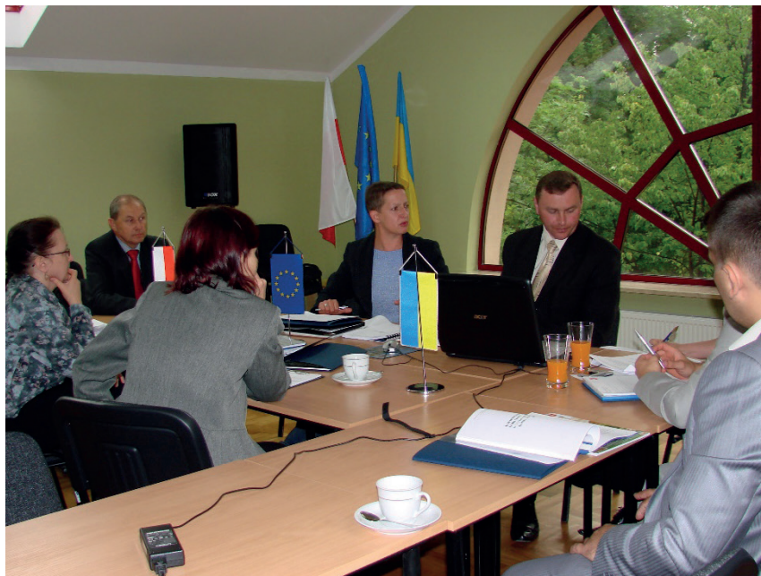
2008 Z Unią nam po drodze