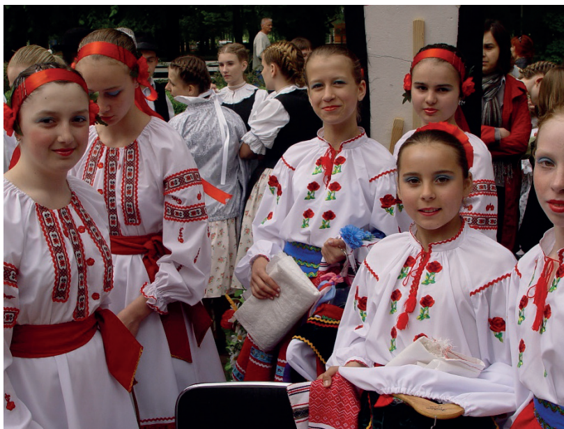
2009 Buskie Spotkania z Folklorem