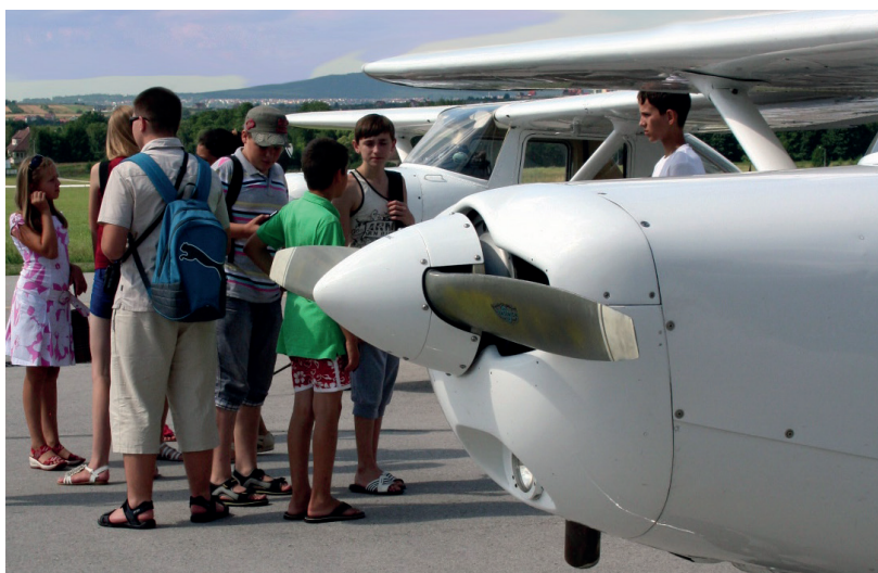
2012 kolonie polsko-ukraińskie