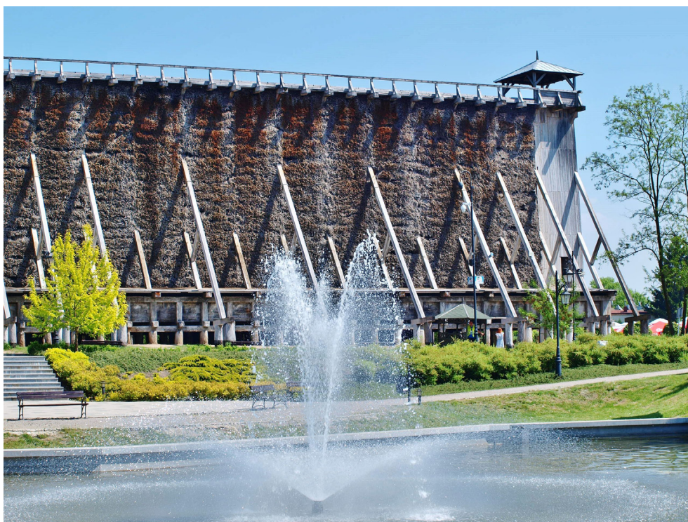
Tężnia solankowa w Ciechocinku