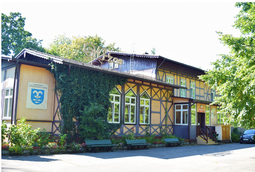
Wrzos – Uzdrawisko Goczałkowice-Zdrój