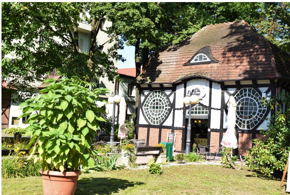
Budynek Pijalni Wód Leczniczych w Goczałkowicach-Zdroju