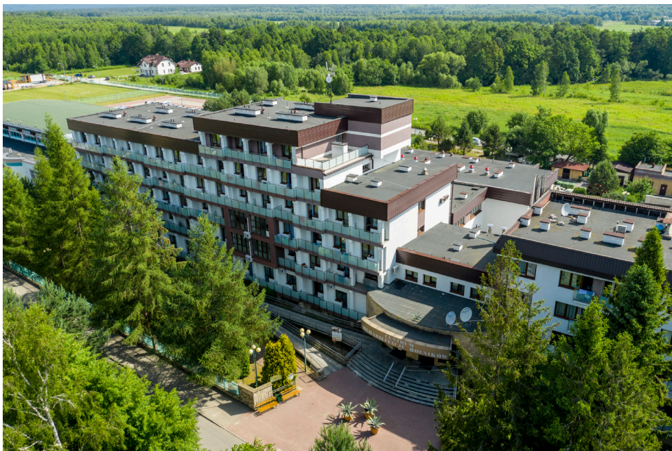
Centrum Rehabilitacji Rolników KRUS w Horyńcu-Zdroju