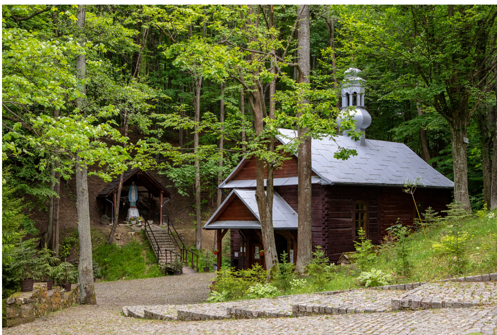
Kapliczka na wodzie w Nowinach Horynieckich