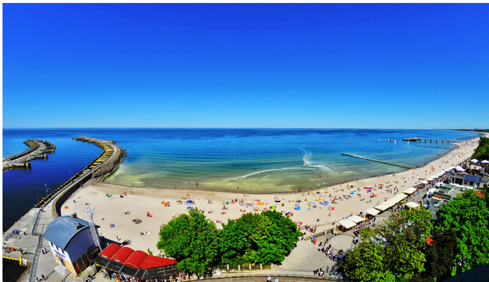
Plaża w Kołobrzegu