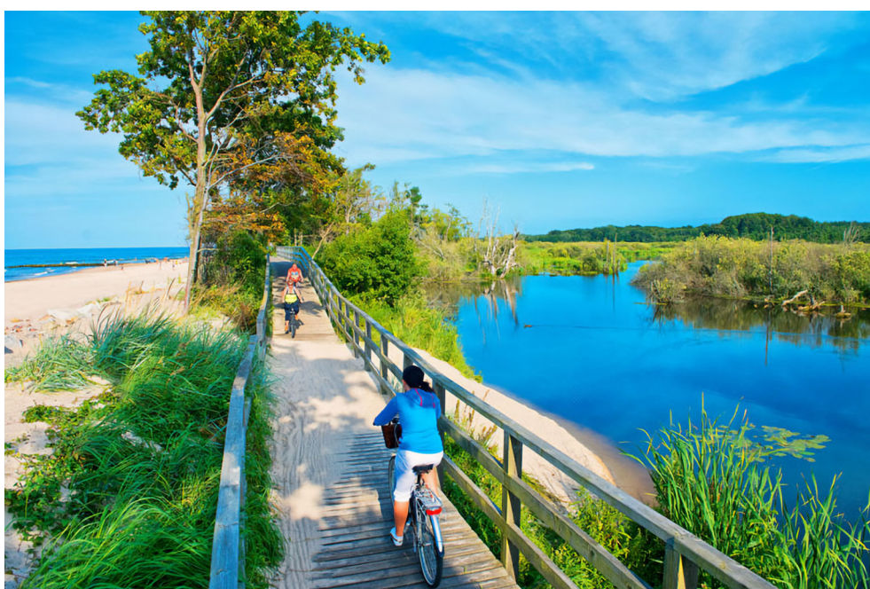
Ścieżka rowerowa prowadząca przez Ekopark Wschodni