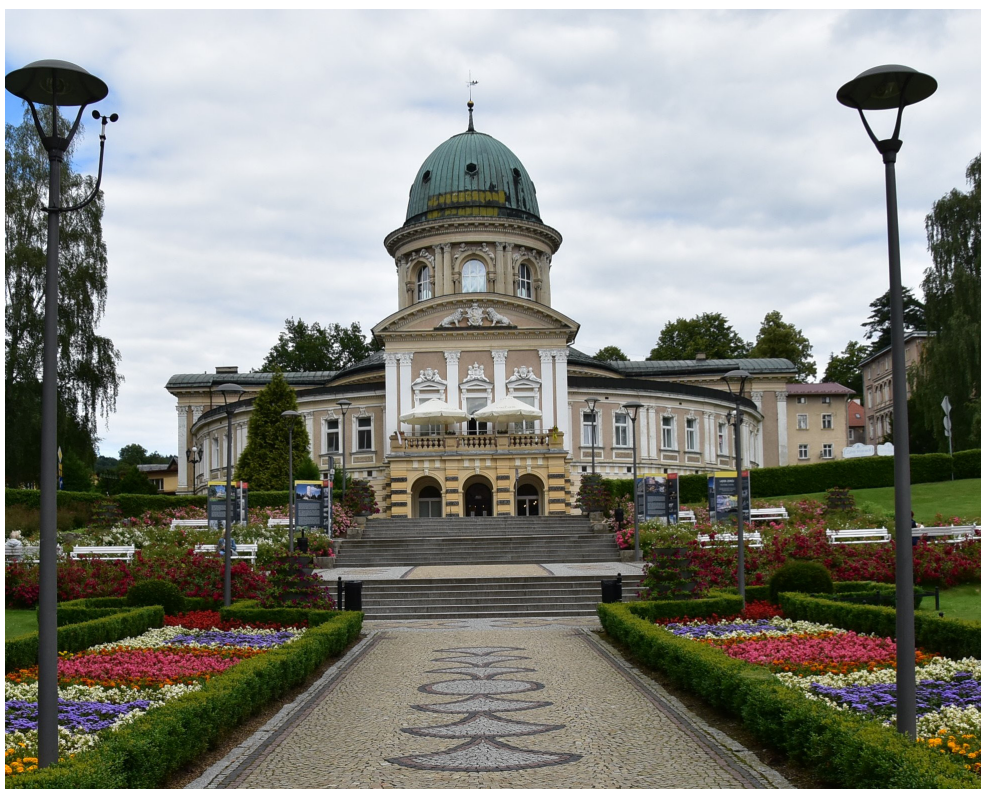
Łądecki Park Zdrojowy