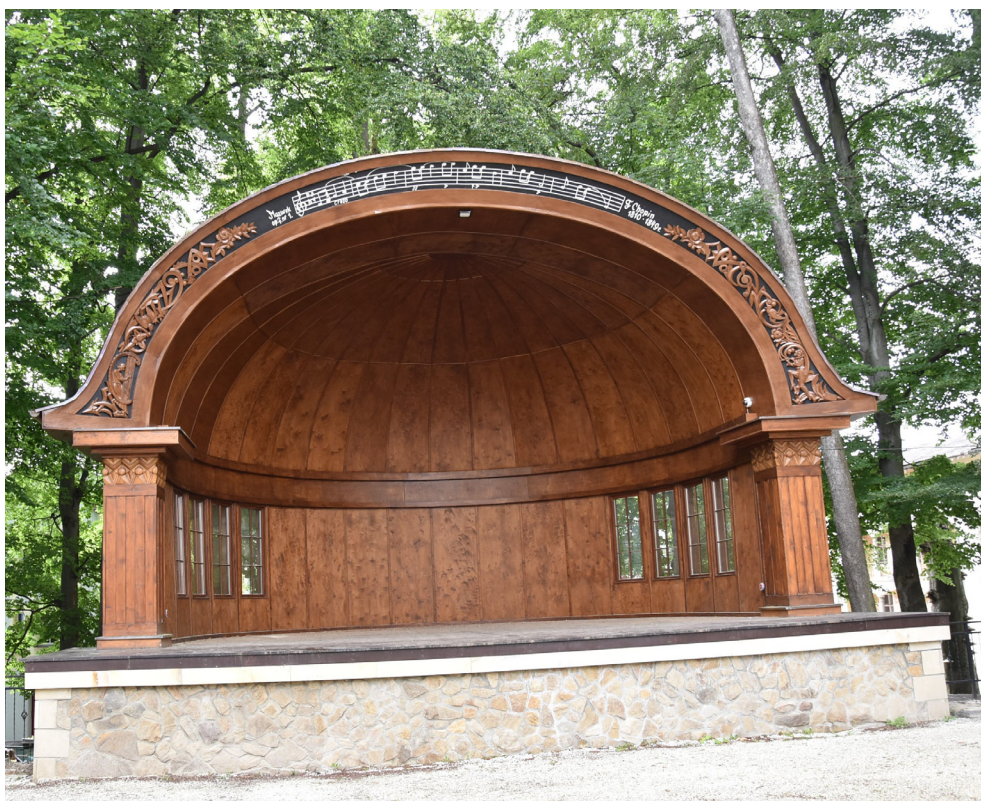
Amfiteatr – Łądek-Zdrój