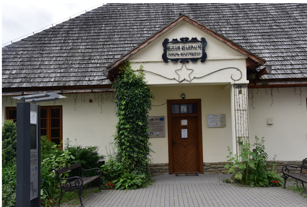
Muzeum Regionalne Państwa Muszyńskiego