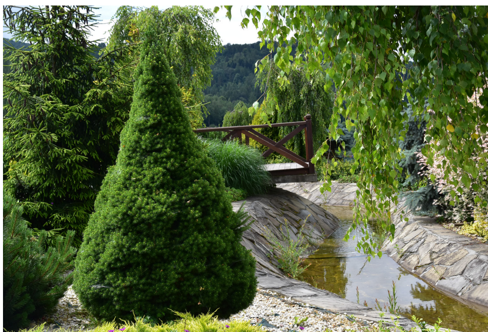
Ogród Sensoryczny w Muszynie