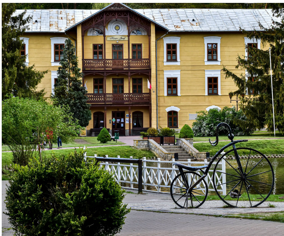
Sanatorium Książę Józef – Nałęczów