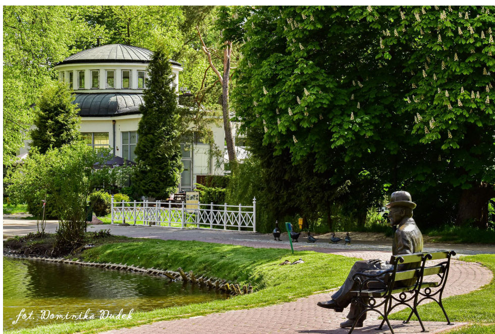
Ławeczka Prusa