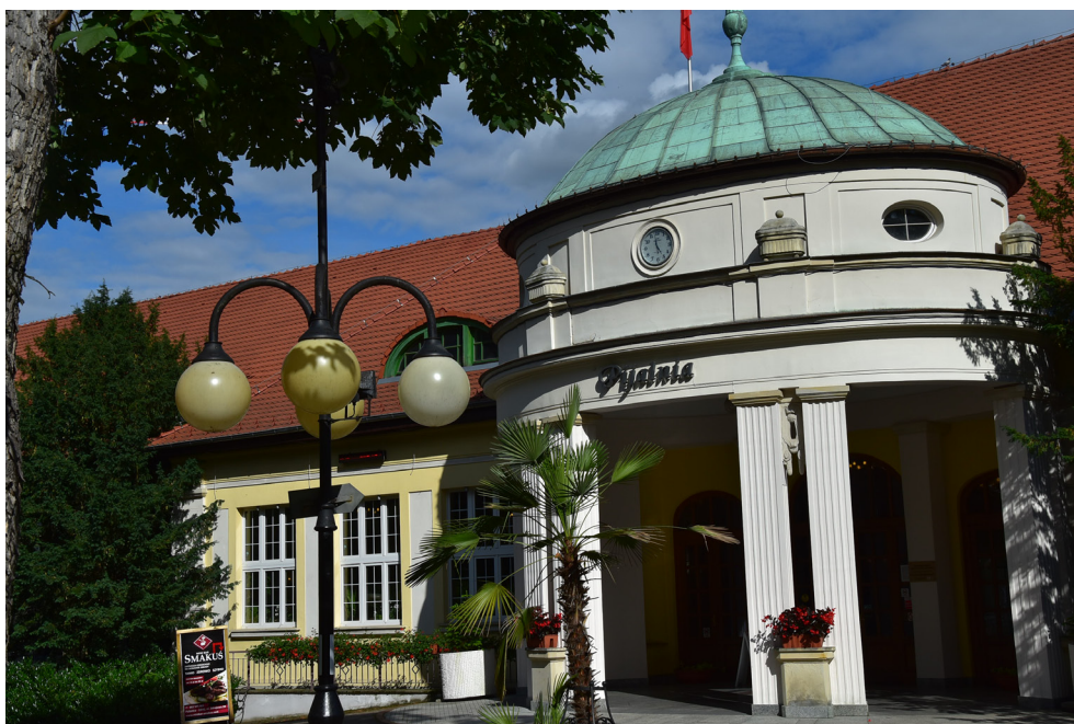
Pijalnia Wód Mineralnych – Wielka Pieniawa w Polanicy-Zdroju