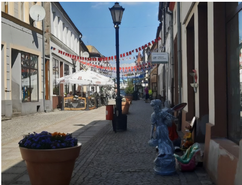
Deptak w Polczynie-Zdroju