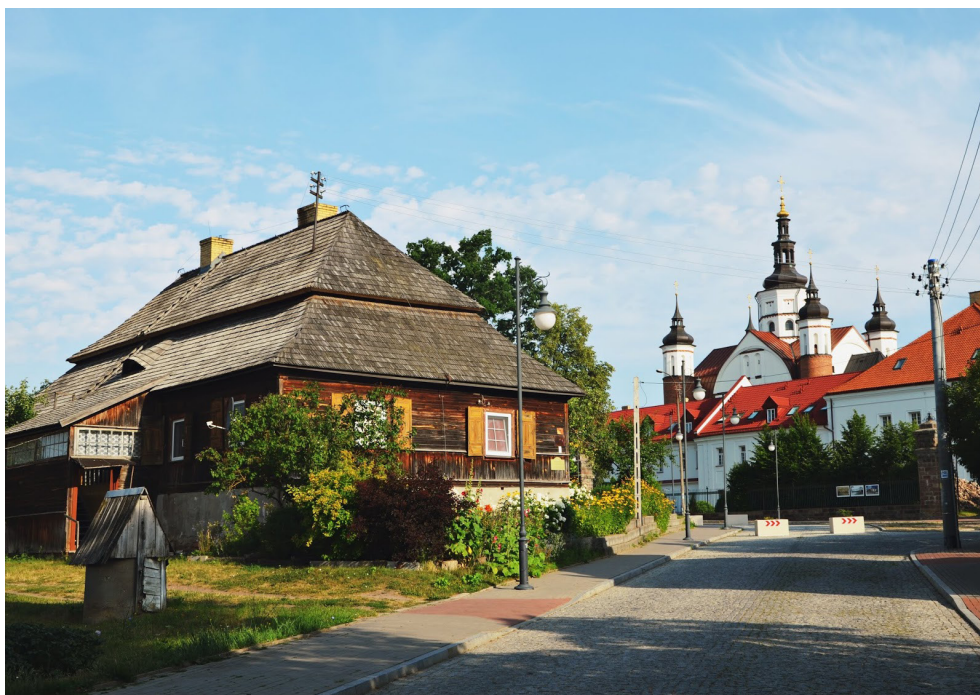
Stara poczta (zwana też Domem Ogrodnika) w Supraślu