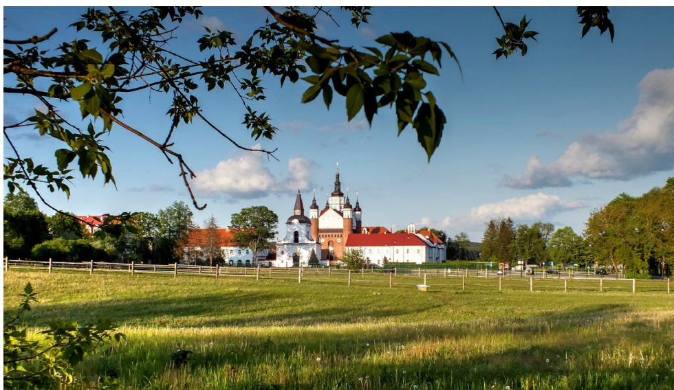
Klasztor Męski Zwiastowania NMP w Supraślu