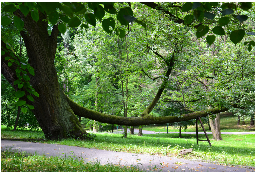
Pomnik przyrody – Lipa Słoń – Park Uzdrowski w Swoszowicach