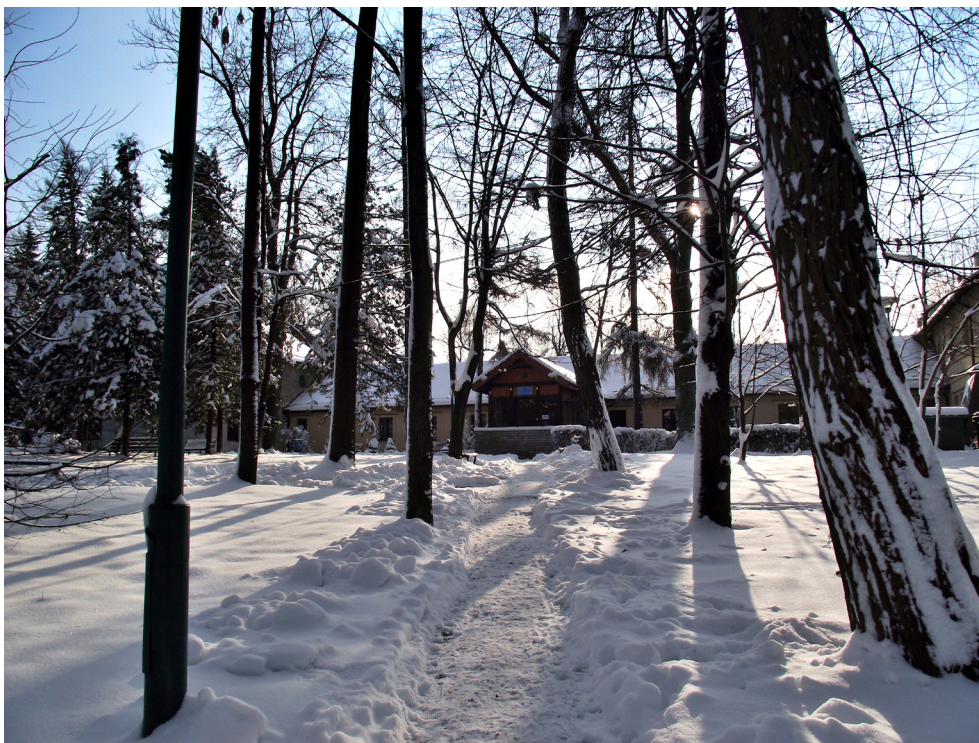
Główny Dom Zdrojowy – Swoszowice