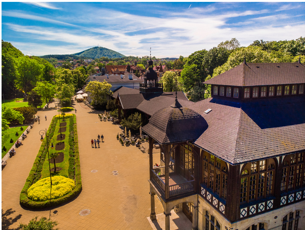
Deptak w Parku Zdrojowym, Pijalnia Wód Mineralnych z Halą Spacerową