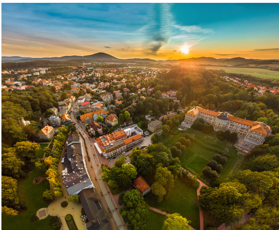
Panorama miasta Szczawno-Zdrój z charakterystycznym budynkiem Domu Zdrojowego, w tle Góra Chelmiec