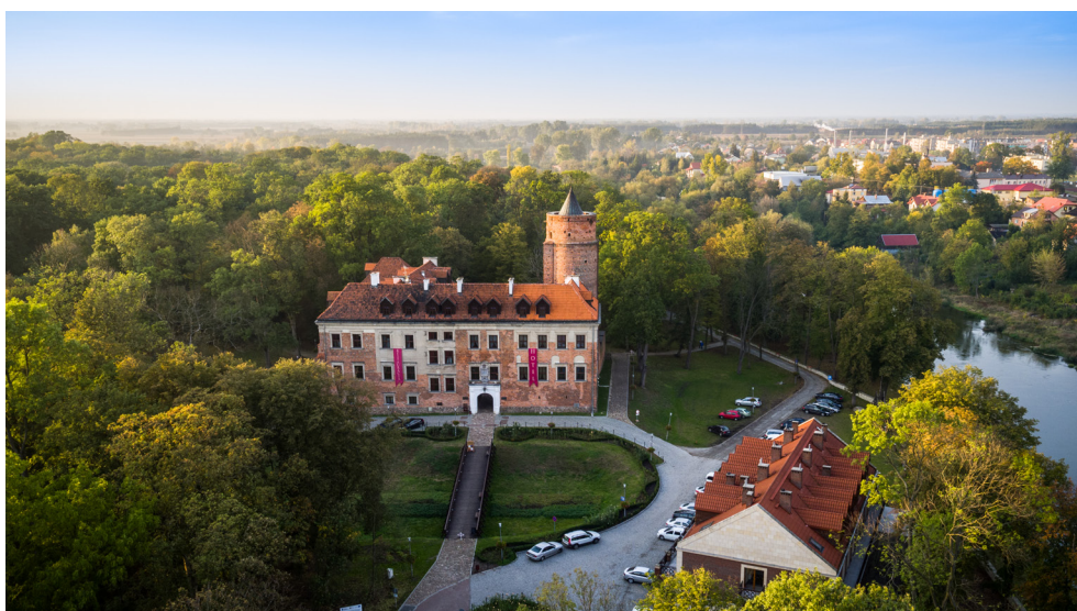
Zamek Arcybiskupów Gnieźnieńskich w Uniejowie