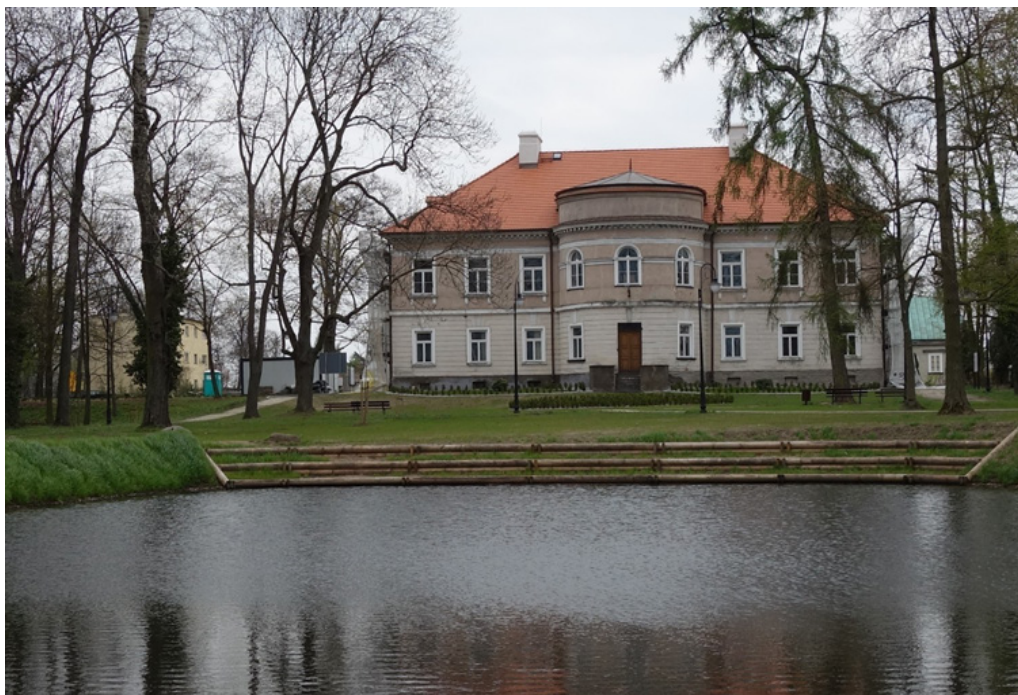
Pałac od strony zachodniej