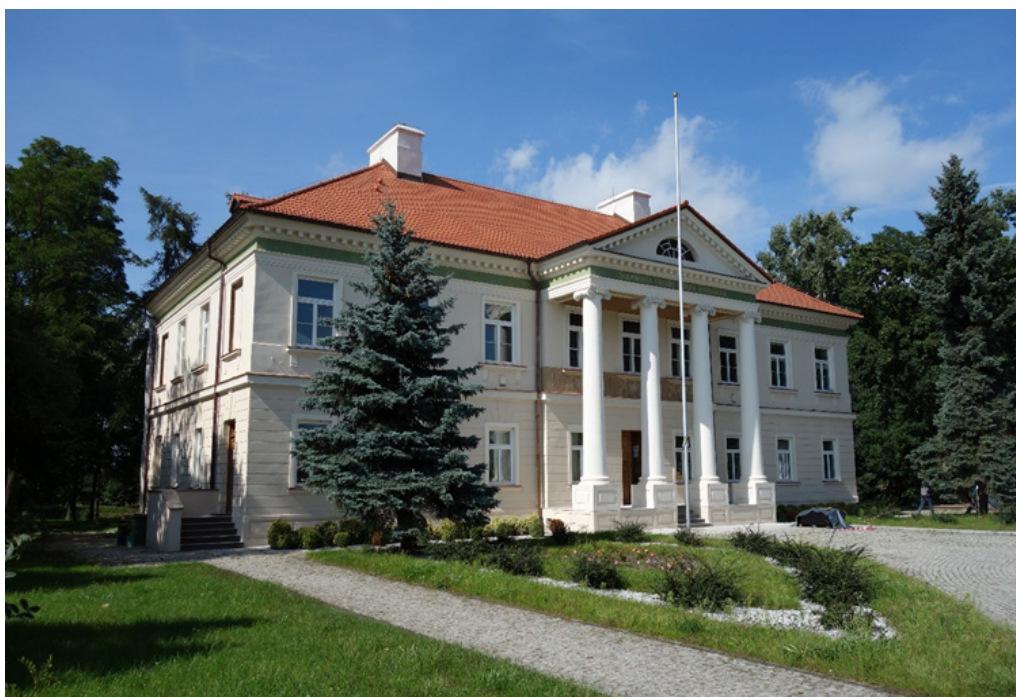
Pałac w Starym Gostkowie

Gmina Wartkowice w lipcu 2020 r. przystąpiła do realizacji zadania pn. „Rewaloryzacja Zabytkowego Parku w Sta- rym Gostkowie” dofinansowanego ze środków Wojewódzkiego Funduszu Ochrony Środowiska i Gospodarki Wodnej w Łodzi. Całkowita wartość zadania stanowiła kwotę 1010492,23 zł, w tym środki finansowe z Wojewódzkiego Fun- duszu Ochrony Środowiska i Gospodarki Wodnej w Łodzi wyniosły 904549,00 zł, z czego kwota pożyczki to wartość 270866,00 zł, a kwota dotacji 633683,00 zł. Zakres realizowanych prac obejmował renowację dwóch zbiorników wod- nych zlokalizowanych w zachodniej części zabytkowego parku, budowę alejki z niesortu granitowego wraz z naprawą istniejących alejek, zagospodarowanie terenu, prace w zieleni polegające na: wycince drzew, krzewów, pracach pielęgn- acyjno – leczniczych w drzewostanie parkowym, sadzeniu nowych drzew i krzewów, wykonaniu klombu z tyłu pałacu, obsadzeniu runa gajów geofitami i bylinami, regeneracji trawników oraz budowie systemu nawodnień dla terenów zie- leni. Celem realizacji zadania było uzyskanie czytelnych wnętrzy parkowych i wykreowanie scenerii parkowych kształtu- jących spójność historycznego charakteru obiektu.