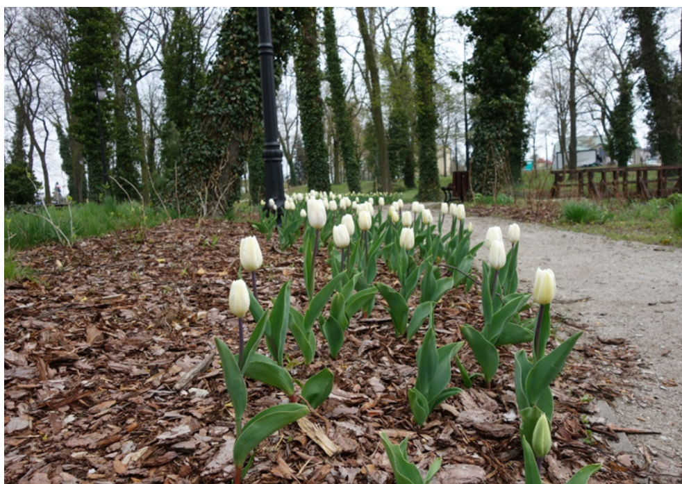
Tulipany na wyspie