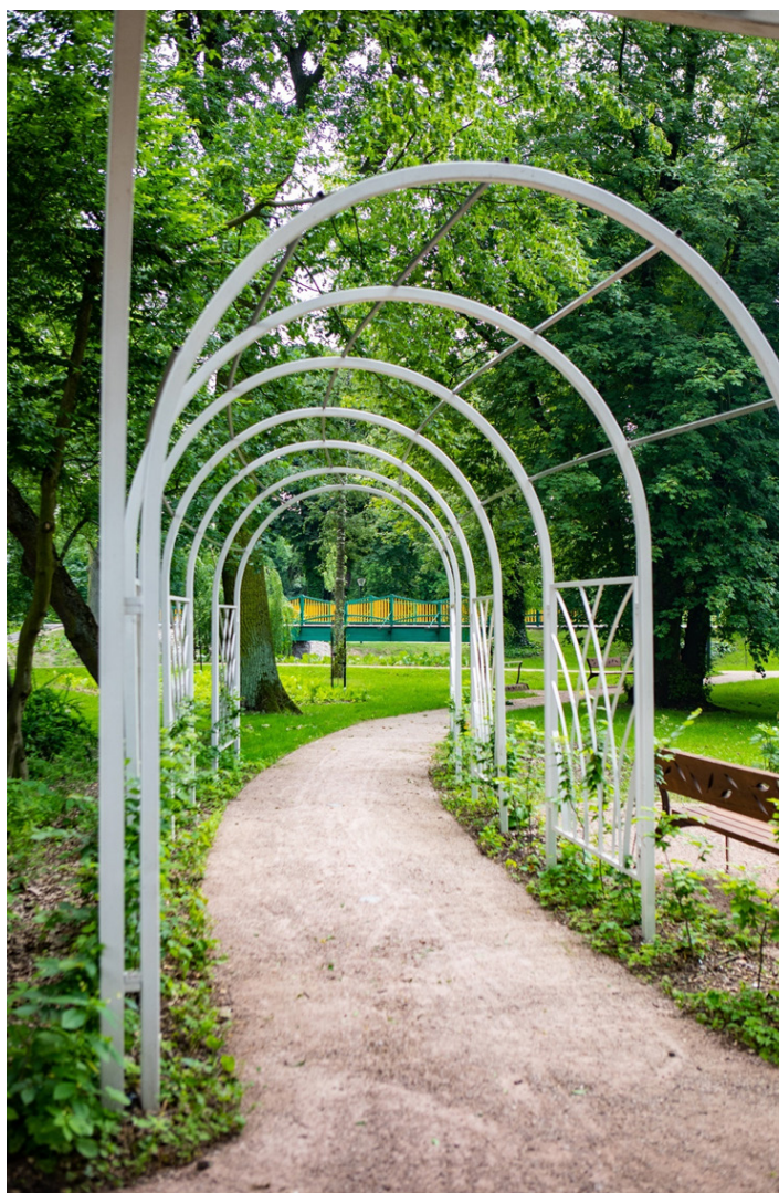
Berso w parku miejskim