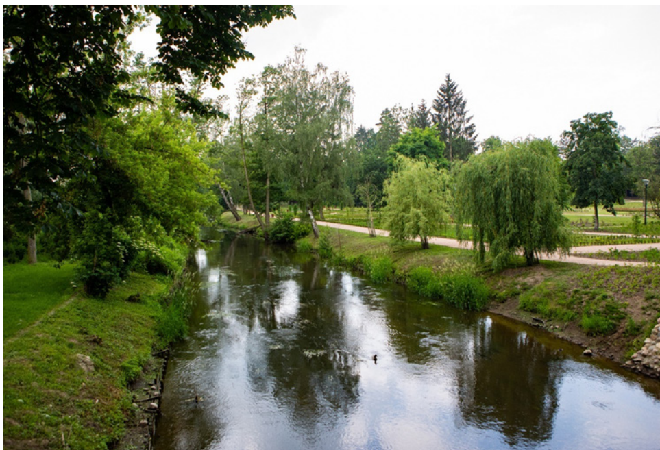
Rzeka Rawka- rezerwat