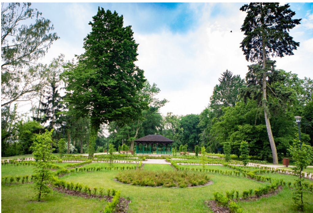
Altana w parku miejskim, fot. Foto Milejka