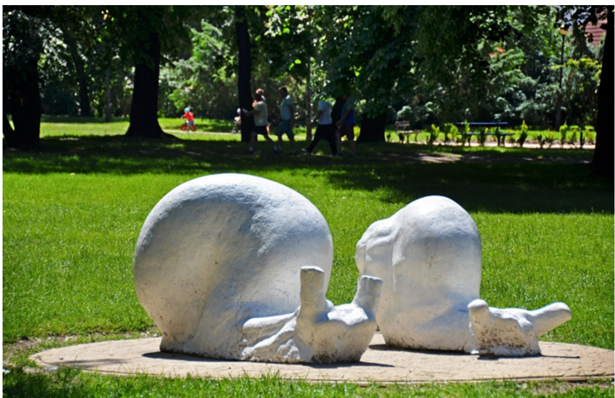
Rzeźba Dwa ślimaki - Park im. Władysława Stanisława Reymonta