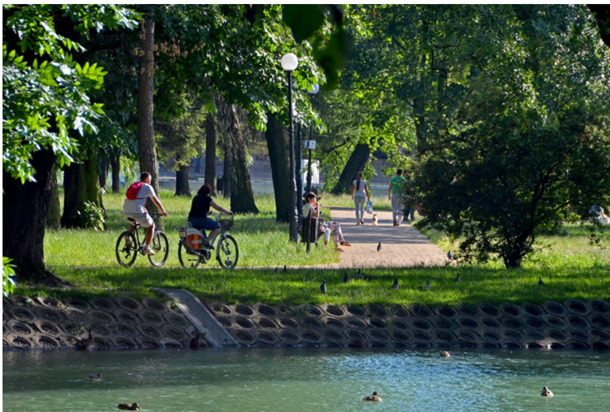
Nad wodą... - Park im. Władysława Stanisława Reymonta