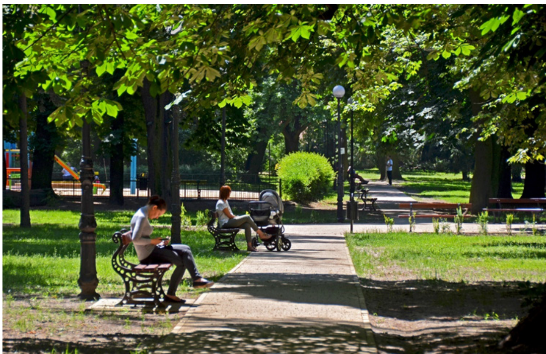
Alejką prowadząca do placu zabaw - Park im. Władysława Stanisława Reymonta