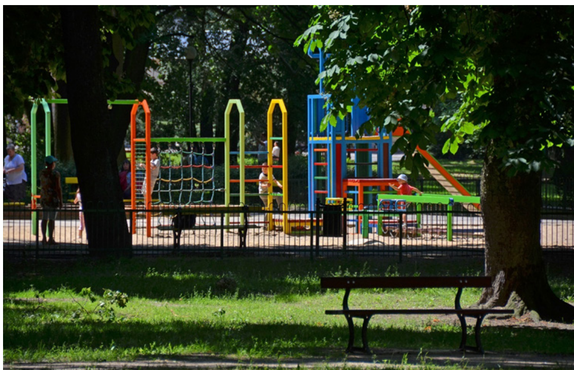
Plac zabaw - Park im. Władysława Stanisława Reymonta