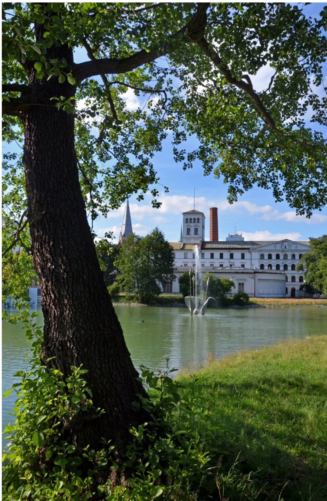
Widok na fontannę i Białą Fabrykę - Centralne Muzeum Włókiennictwa