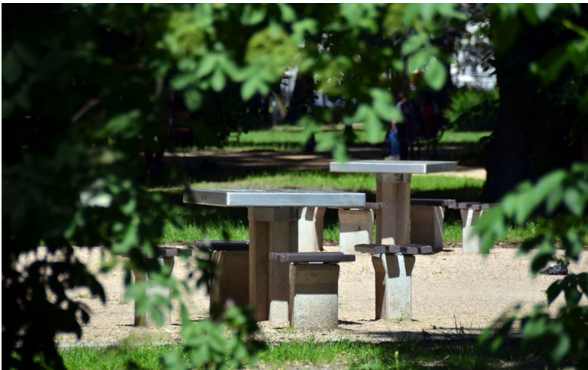
Zestawy stolików szachowych - Park im. Władysława Stanisława Reymonta