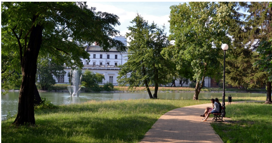
Aleja okalająca staw - Park im. Władysława Stanisława Reymonta

W 2015 r. przeprowadzono inwestycję pn. „Rewaloryzacja Parku im. Wł. Reymonta”. W ramach zadania: odmulono staw, poprawiono umocnienie jego brzegów (betonowymi, ażurowymi płytami), odrestaurowano balustradę od ul. Piotrkowskiej i przebudowano od strony parku poprzez likwidację donic-koryt stanowiących część balustrady, przeprowadzono renowację schodów prowadzących do stawu, wymieniono nawierzchnie alejek na kostkę betonową z posypką mineralną, wytyczono nowe alejki żwirkowo-glinkowe, doposażono obiekt ławki i kosze na śmieci, wymieniono stoliki szachowe, odrestaurowano i pomalowano rzeźbę „Dwa ślimaki”.