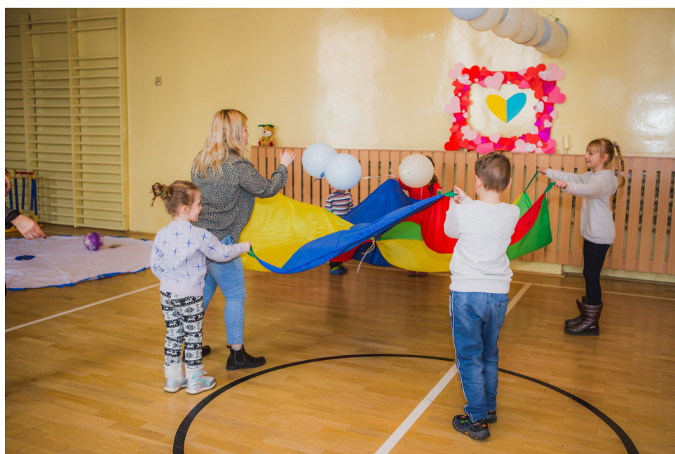
Zajęcia edukacyjne dla dzieci z Ukrainy

Miasto zaoferowało także bezpłatne zajęcia edukacyjne dla dzieci z Ukrainy. Zajęcia realizowane były przez ostrowskie przedszkola, a odbywały się w świetlicy działającej przy Domu Polsko – Ukraińskim. Miasto przeprowadziło także akcję „Plecaki pełne miłości”, w ramach której dzieci z Ukrainy otrzymały bezpłatną wyprawkę do szkoły.