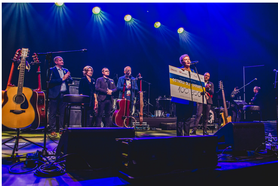
Koncert charytatywny Ostrów dla Ukrainy

„Ostrów dla Ukrainy” – to hasło wielkiego koncertu charytatywnego dla Ukrainy zorganizowanego w Ostrowie Wielkopolskim. Wystąpili w nim tacy artyści jak: Maciej Balcar, Big Cyc, Czarno-Czarni oraz Pectus. Gościem specjalnym wydarzenia był ukraińsko-polski zespół Dagadana. Całkowity dochód z wydarzenia - w sumie 100 950 złotych - został przekazany na pomoc Ukrainie. Wielki koncert w Arenie Ostrów pozwolił nie tylko zebrać dodatkowe środki na dalszą pomoc dla mieszkańców Ukrainy, ale także zjednoczyć wszystkich ludzi dobrej woli.