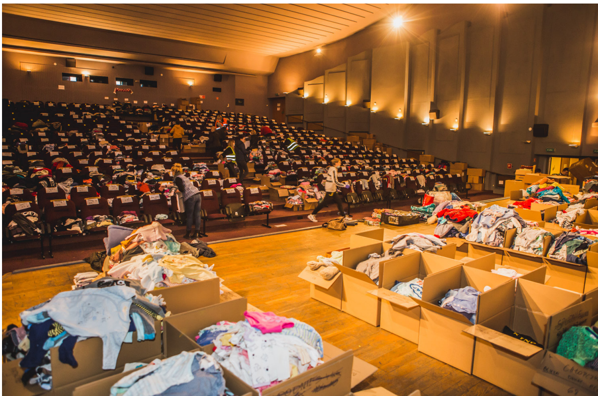
Magazyn darów w dawnym kinie Komeda