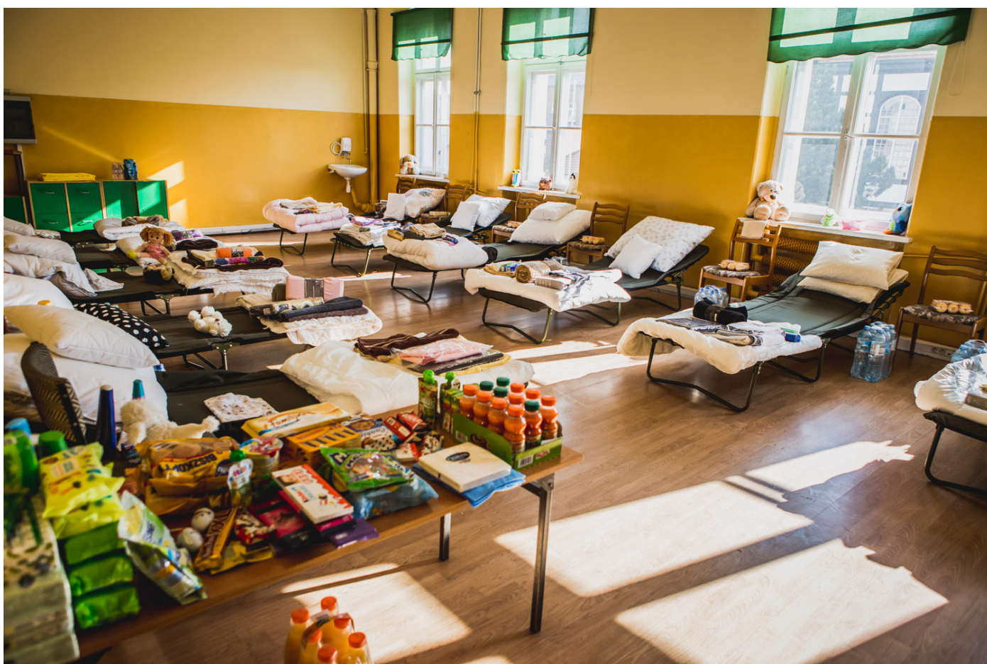
Dom Polsko - Ukraiński

Powstanie domu nie byłoby możliwe gdyby nie pomoc wolontariuszy - mieszkańców Ostrowa Wielkopolskiego, samorządowców, urzędników, strażaków ochotników i wielu innych ludzi dobrej woli. W ramach uruchomionej przez miasto „bazy pomocy” mieszkańcy oferują swoje wsparcie jako tłumacze, kierowcy, pedagodzy, psycholodzy, położne, lekarze, nauczyciele. Pomoc płynie także od ostrowskich restauratorów, którzy od początku wojny zapewniają uchodźcom ciepłe posiłki. W mieście działa także baza oferowanych przez ostrowian pokoi, mieszkań i domów.