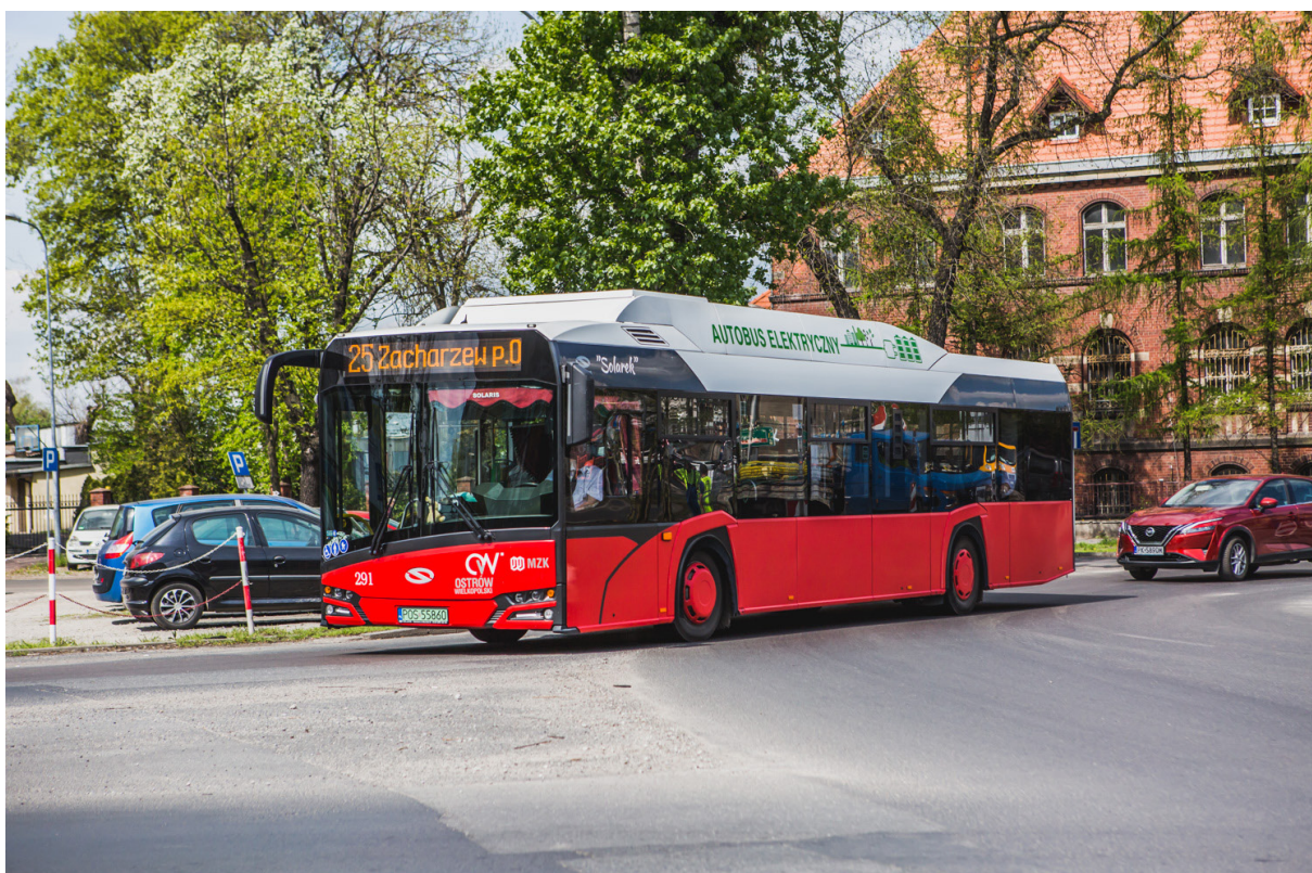
Bezpłatne przejazdy komunikacją miejską

Rada Miejska Ostrowa Wielkopolskiego podjęła uchwałę dotyczącą darmowego transportu autobusami MZK dla uchodźców z Ukrainy. Darmowe przejazdy obowiązują do końca czerwca tego roku. Mogą z nich skorzystać obywatele Ukrainy, którzy przyjechali do Polski po 24 lutego tego roku.