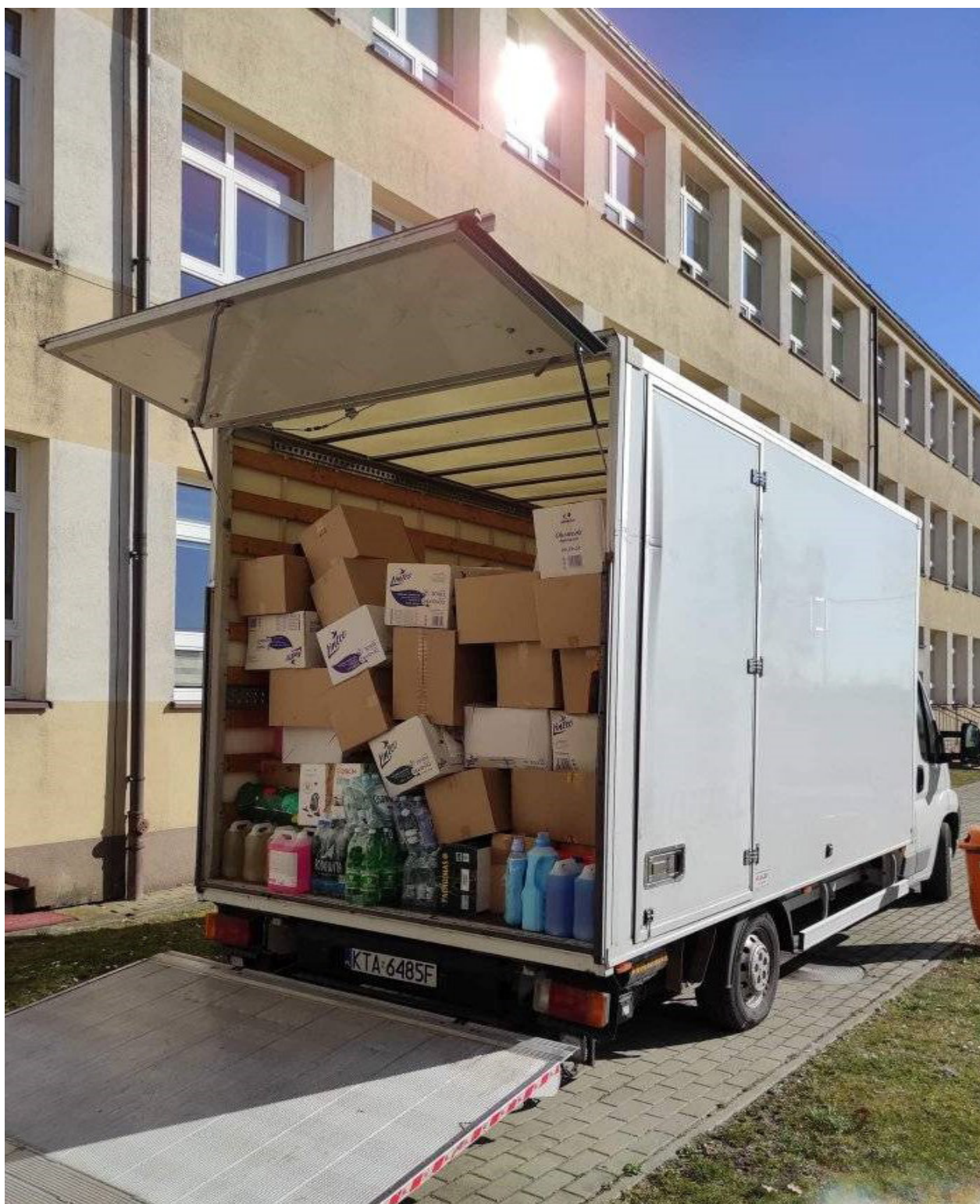
Dary zebrane przez mieszkańców gminy, które zostały przekazane na Ukrainę