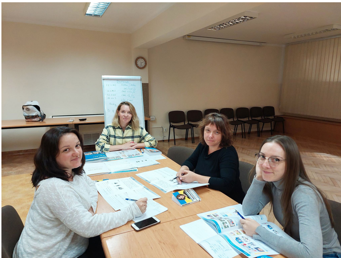
Lekcje języka polskiego w Centrum Kultury w Żabnie