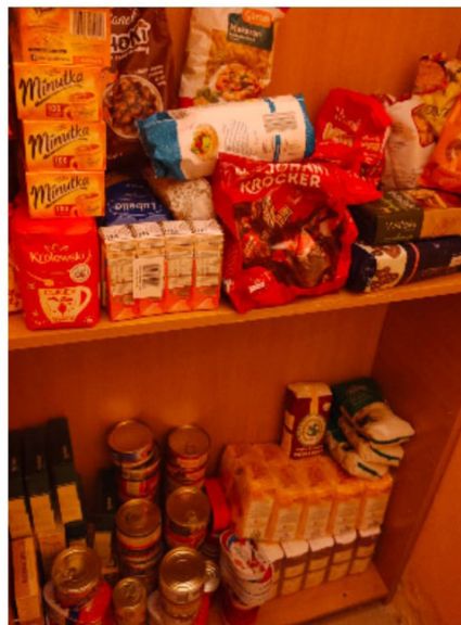
Przygotowania do zakwaterowania uchodźców w budynku po byłym przedszkolu w Żabnie