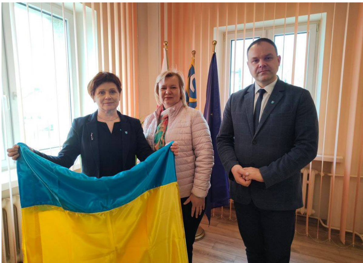
Symboliczne przekazanie flagi Ukrainy na ręce Pani Burmistrz przez Panią Nadię uchodźczynię mieszkającą na terenie gminy, która została przyjęta na staż w Urzędzie Miejskim w Żabnie