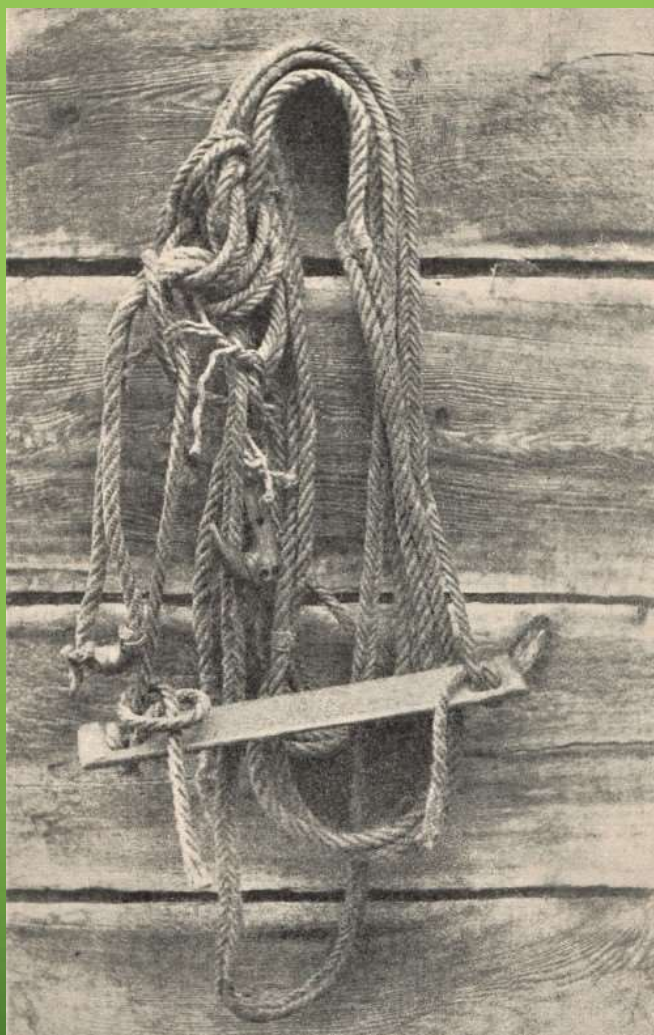
LEZIWO ZNAJDUJĄCE SIĘ PRZED 1939 R. W MUZEUM KURPIOWSKIM W NOWOGRODZIE ŁOMŻYŃSKIM