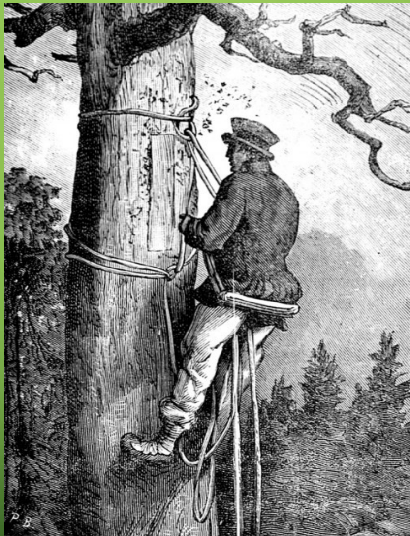
BARTNIK KURPIOWSKI; RYCINA Z CZASOPISMA "ZORZA", R. 19, NR 2 (10 STYCZNIA 1884)