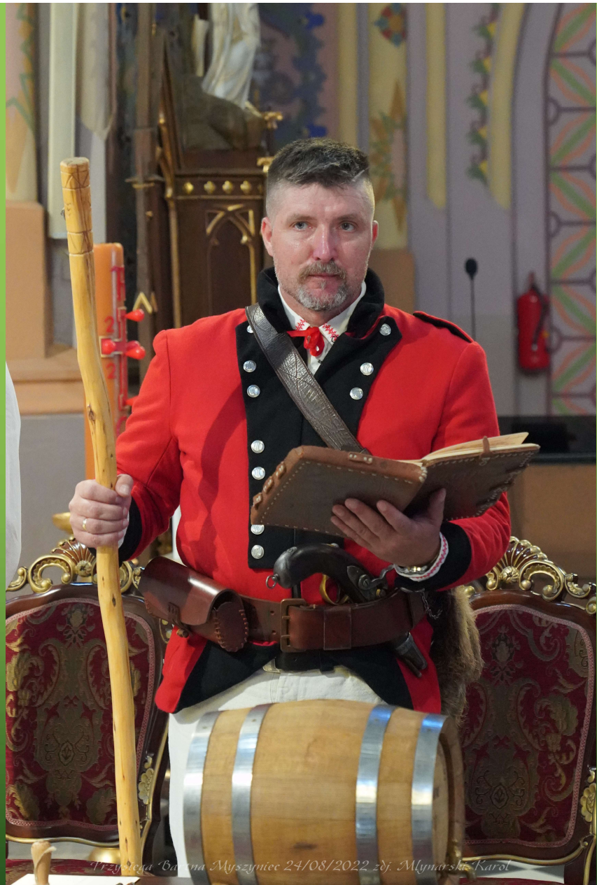
Przystępa 'Ciepła Myszyniec 24/08/2022